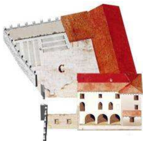
l'hospitale di S. Giovanni di Gerusalemme

Gli scavi archeologici iniziati nel 2007 hanno portato alla luce lacerti murari con tracciati che evidenziano la presenza di impianti costruttivi precedenti, ancora più antichi e che saranno oggetto di ulteriori scavi e verifiche anche durante i lavori.