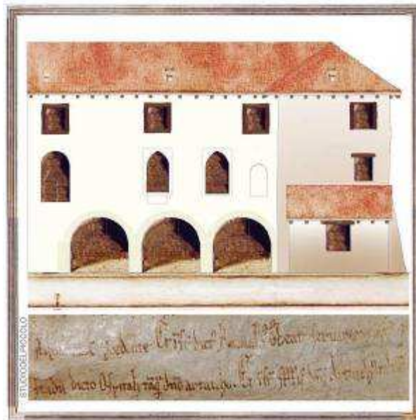
la casa del Priore

Il sito è affioramento sorprendente della nostra storia. Quale miglior modo per comprenderla: arrivarci a piedi, essere accolti, passarci la notte, sulle orme e dove hanno sostato migliaia di persone che andavano in Terrasanta, a Roma, a Santiago, a piedi.