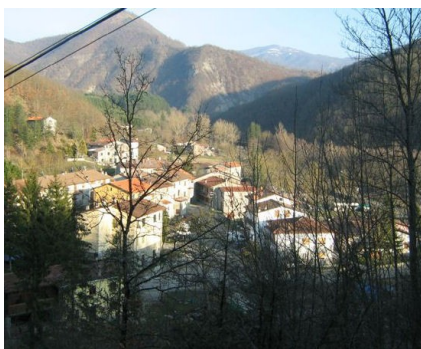
Panorama di Rimbochi

Romano Conti : via Cesalpino 35 – 52100 Arezzo tel 0575.323832 -- 333.9966612 mail : contivete@alice.it